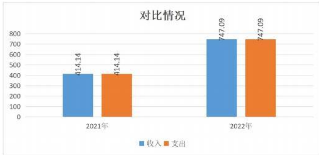
图三：2022 年财政拨款收支与 2021 年度决算对比情况