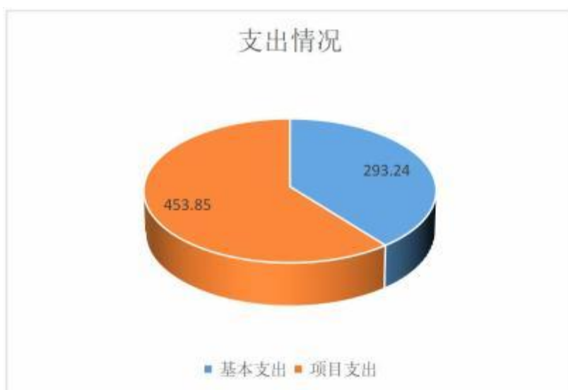
图二：2022 年度支出明细